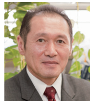
専攻主任 教授 博士(医学)・臨床心理士・公認心理師

現代社会やそこに生きる人々が抱える心の諸問題を解決するために、人の心に関する理論を作り上げ、その理論を人の心の理解と支援に応用する心理学の役割はますます大きくなっています。心理学専攻では、社会の要請に応える研究・教育を実践します。「臨床心理学コース」では、高度な専門的知識と技能を備え、臨床心理の現場で、科学的視点で実践的な活動を行う人材を養成します。「心理科学コース」では、創造性豊かな優れた研究を遂行する能力をもつ人材、先端の専門的知識と技術を社会で応用できる人材を養成します。未来を変える心理学の力を信じて、皆さんを待っています。