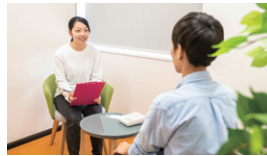
カウンセリング実習室