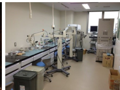
外科研究室 大学棟8階805